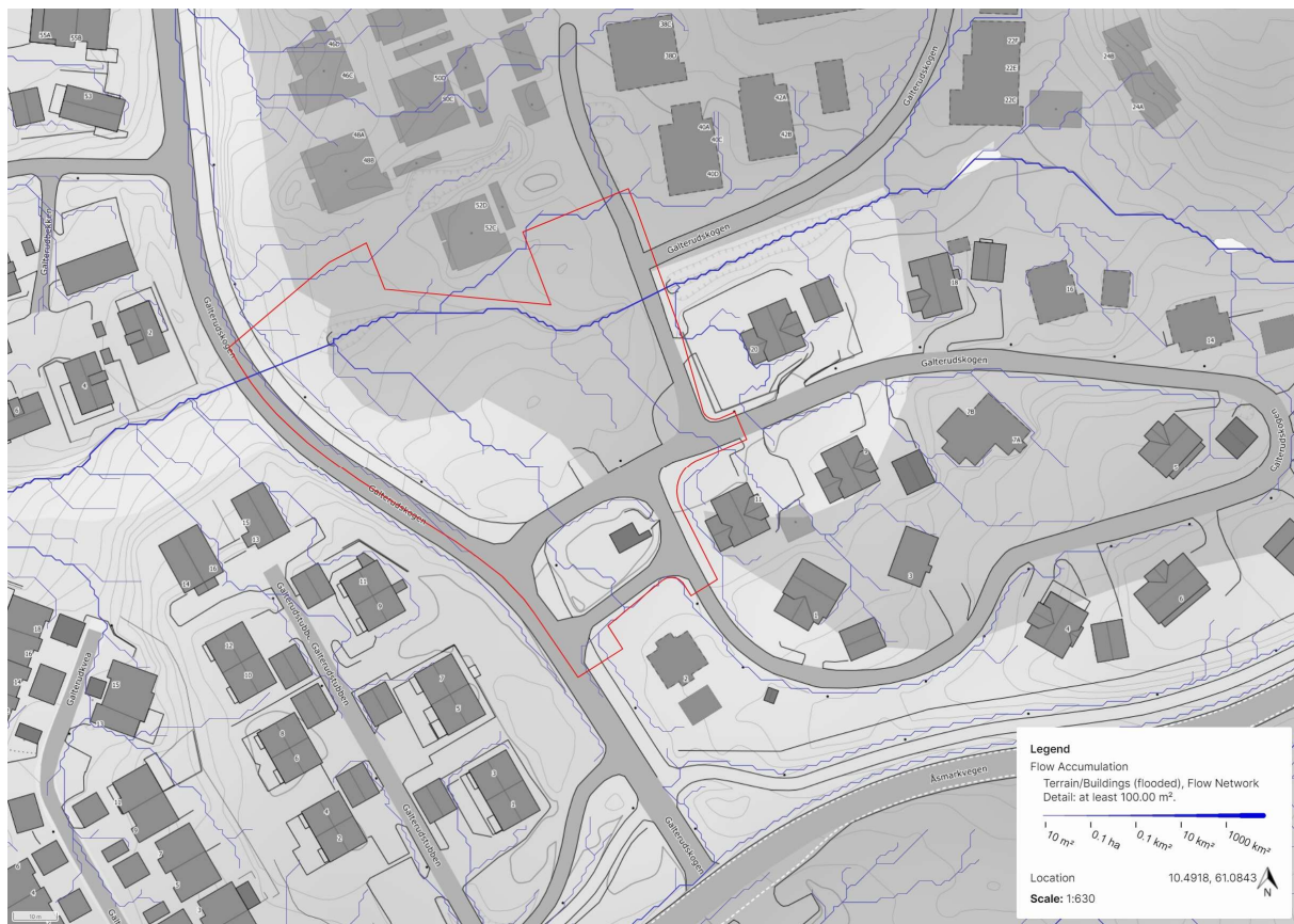
FIGUR 4 DRENERINGSLINJER BASERT PÅ ANALYSE AV TERRENGDATA MED SCALGO LIVE. TERSKELVERDI FOR DRENERINGSLINJENE ER SATT TIL 100 M 2 . PLANOMRÅDET ER MARKERT MED RØDT OMRISS.

Dreneringslinjer vist på figur 4 er beregnet med Scalgo Live ut fra NDH (nasjonal digital høydemodell) med oppløsning 1 m. Bortsett fra bekken gjennom planområdet er det ingen større dreneringslinjer som indikerer at området vil få tilført skadelige mengder overvann i en flomsituasjon. Et mindre område sørøst for planområdet på ca 7 daa drenerer i dag gjennom planområdet og til bekken, og dette overvannet må ledes unna planlagt ny bebyggelse og til bekken.