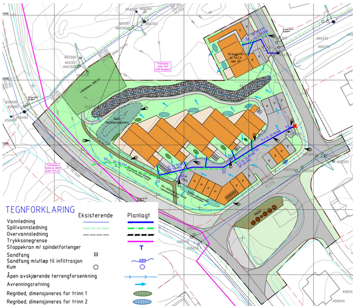
FIGUR 7 PLANLAGTE OVERVANNSTILTAK, UTKLIPP FRA TEGNING GH01 (VEDLEGG 1)