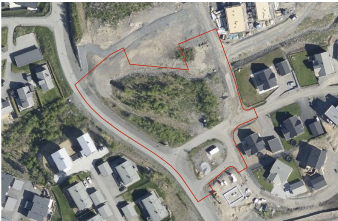
FIGUR 2 ORTOFOTO 2020 (NORGE I BILDER) AV PLANOMRÅDET (RØDT OMRIS)