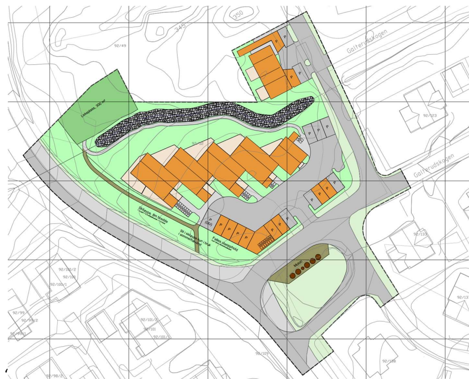
FIGUR 6 ILLUSTRASJONSPLAN FOR NY BEBYGGELSE PER 28.11.2022