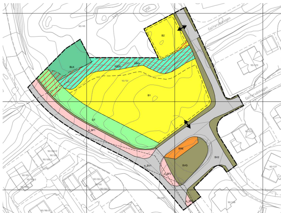
FIGUR 5 REGULERINGSPLANFORSLAG PER 28.11.2022

Planområdet på 6,8 daa planlegges bebygd med 2 rekkehus med til sammen 7 enheter fordelt på byggeområdene B1 og B2. Tilhørende adkomstveg og biloppstillingsplasser, og lekeplass vil også bli etablert.