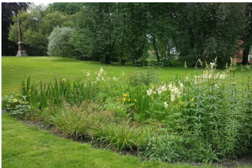
FIGUR 9 EKSEMPEL PÅ REGNBED

Det anbefales at lekeplass anlegges uten bruk av tette flater, eller at evt. bruk av tette flater kompenseres med forsenkninger, regnbед eller tilsvarende.