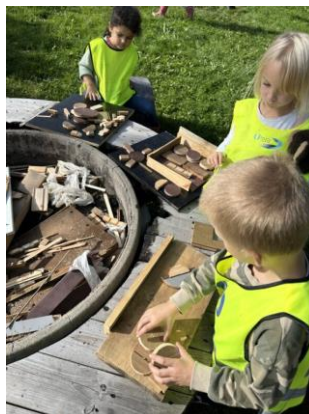
Kreativ lek med ulike former