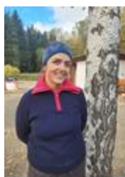
Lene H. F