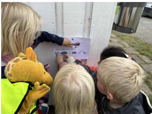
Tarkus lærer oss om trafikksikkerhet.