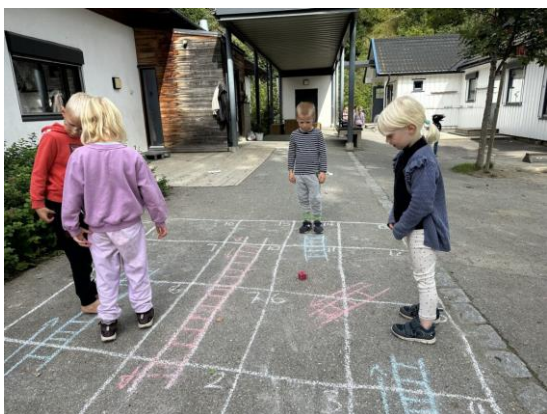
Stige spill ute

Barnas siste år i barnehagen er et ekstra spennende år. Da blir de med i skolestartergruppa, «Jupiterklubben». De fleste barna i Vingrom barnehage begynner på Vingrom skole, og vi får derfor en verdifull mulighet til å jobbe med gruppa allerede før de begynner på skolen. I Jupiterklubben jobber vi blant annet med noe som heter «skrivedans». Skrivedans er en metode som bruker musikk og bevegelser som en måte å forberede skriving på. I tillegg leker vi med farger, former, tall, øver på rim, regler, bokstaver, klipper, limer og gjør impulsive aktiviteter utfra hva barna ønsker. Kort sagt, vi leker og lærer sammen!