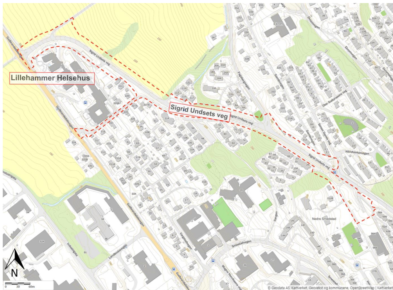
Figur 1: Planområdet