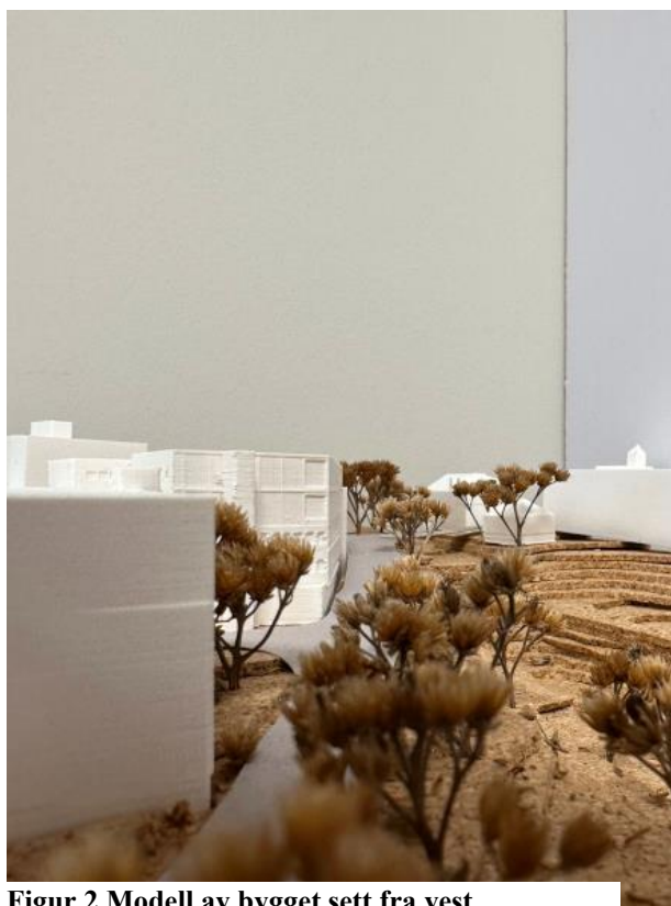
Figur 2 Modell av bygget sett fra vest