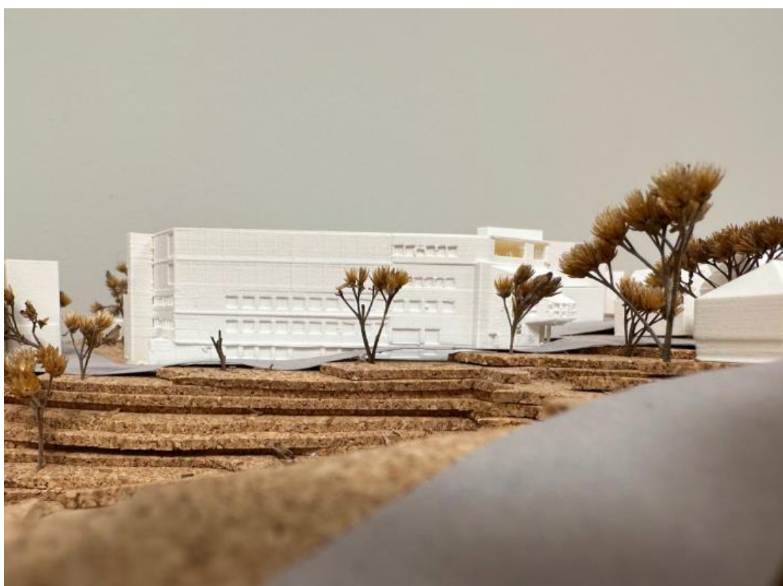
Figur 4 Modell av bygget sett fra Elvegata