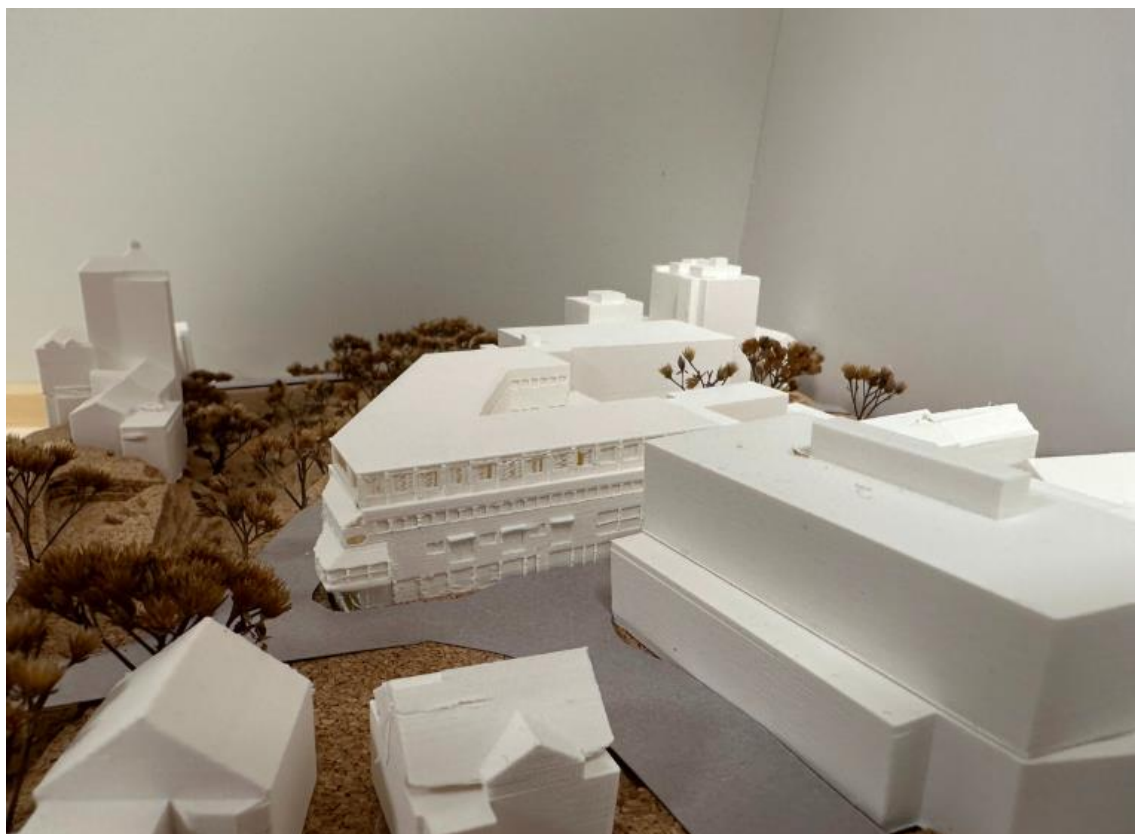
Figur 3 Modell av bygget sett fra øst