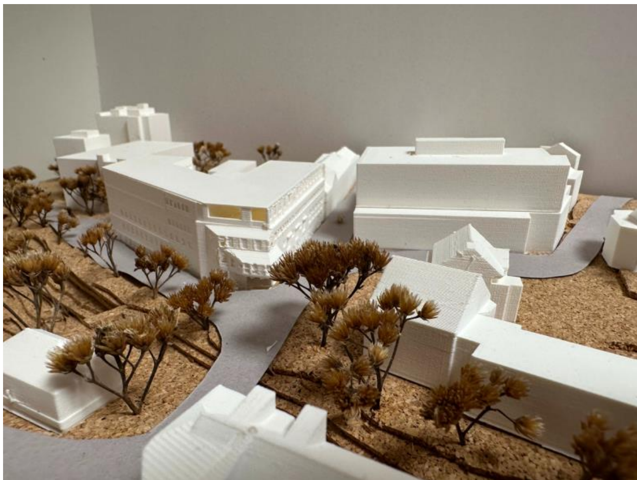
Figur 1 Modell av bygget i fugleperspektiv. Sett fra sør øst