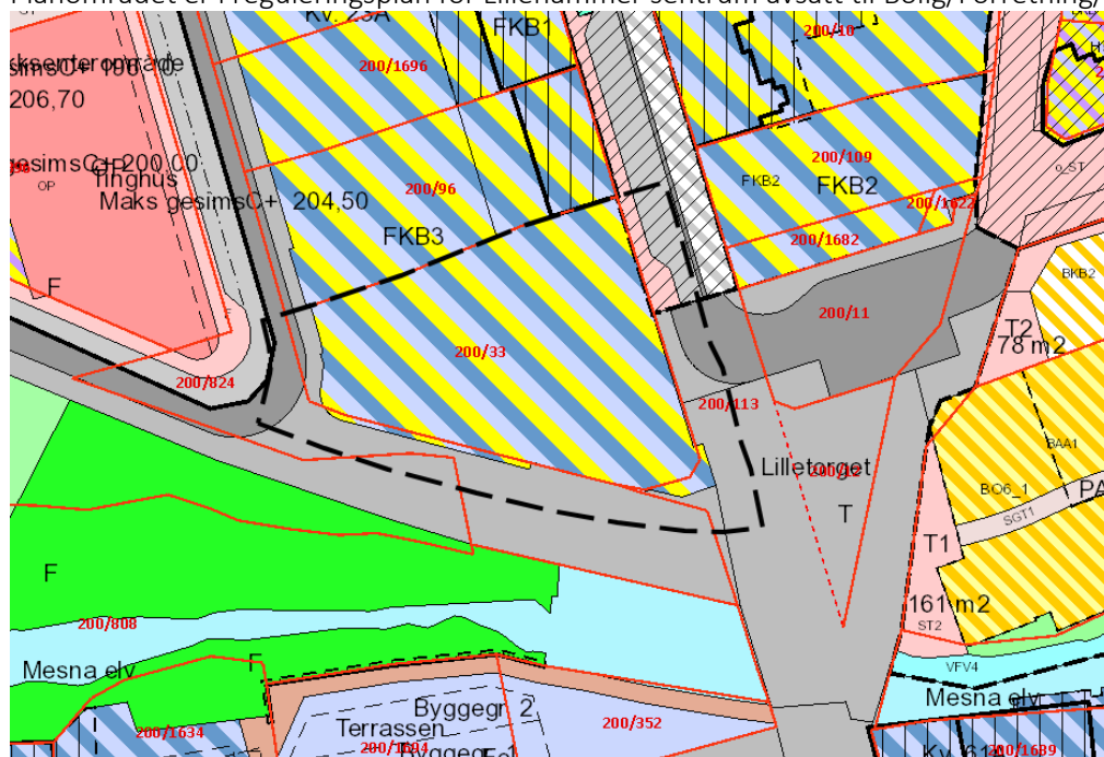
Figur 7 Planavgrensing med reguleringsplan i bakgrunn

Planområdet er i reguleringsplan for Lillehammer sentrum avsatt til Bolig/Forretning/Kontor.